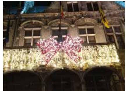
Historisch cadeautje Grote Markt