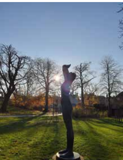
Madame Soleil Stadspark