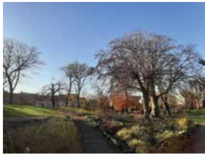
De kale schoonheid van de kleurrijke leegte Stadspark