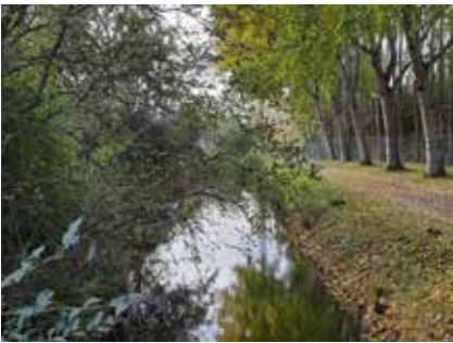
Groene stroom Kwintestraat

Katrien Seghers sloot 2019 af met eigenwijze en verrassende foto's van onze mooie stad. Ze vond plekjes die voor veel mensen een verborgen parel blijken te zijn of ze gooide een creatieve blik op alledaagse beelden. Bedankt Katrien!