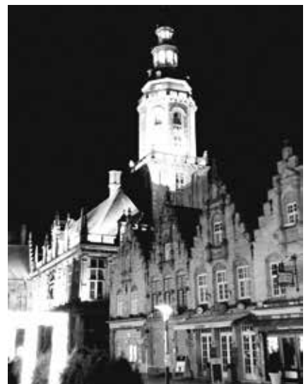
Postkaartfavoriet Grote Markt