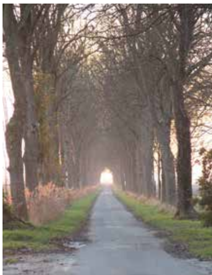
Boulevard des Chateaux Kasteeldreef