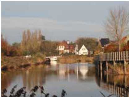
Peis en vree Calonnegracht