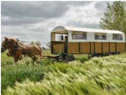
Doorheen Wuivende Velden Steenkerke