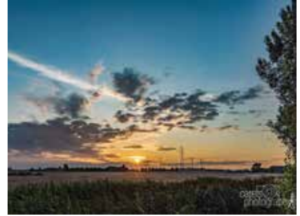
Krokodil eet zon Boitshoeke