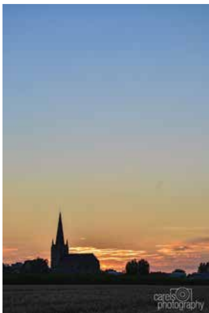
Skyline Zuid Butskamp