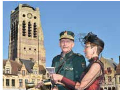
Luide ambassadeur Grote Markt