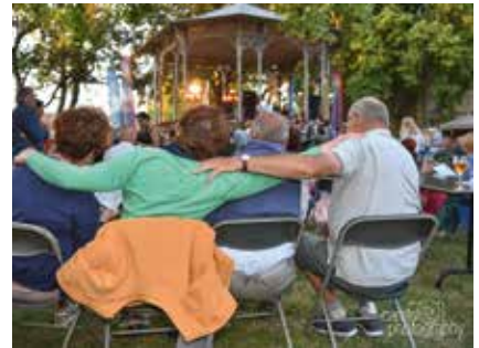
Wegwieg richting warme zomer Stadspark