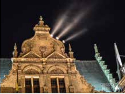
Groene stroom Driekoningen zien het licht Grote Markt

Het nieuwe jaar werd opvallend ingezet met de foto's van Walter Carels. Het mag niet verbazen dat Walter ons deed watertanden, want hij is professioneel fotograaf met een arends-blik. Bedankt voor de prachtige beelden Walter!