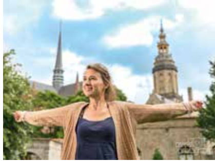
15 januari is Maudverjaardag Hoge Mote