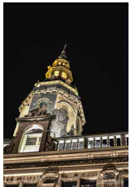
Uitstekende ambassadeur Grote Markt