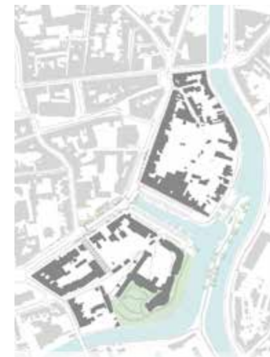
Boven zie je de huidige ruimtelijke planning. Onderaan zie je hoe de omgeving er in de toekomst kan uitzien

Fase 2 en 3 bepalen de invulling van de volledige zone rond de Kaaiplaats en zullen tussen de 10 en 20 jaar merkbaar zijn. Deze fases zijn sterk afhankelijk van private ontwikkelingen zoals de verkoop van huizen of gebouwen.