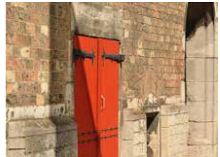
Little red door Ooststraat