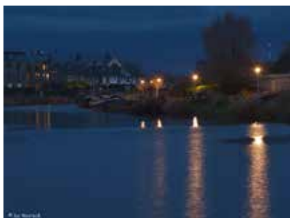
De lichtjes van de Calonnegracht Hogbrugstraat