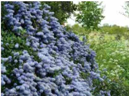
Purple haze Gasthuisstraat