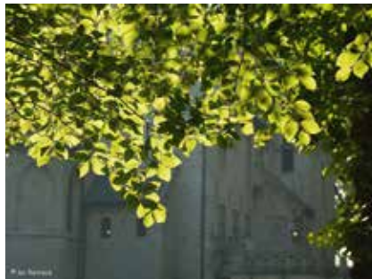
Parasol Kasteel Beauvoorde