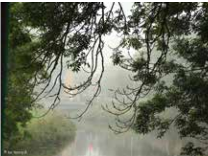
Stilte na de storm Rozenbrugpad

We zijn altijd op zoek naar nieuwe ambassadeurs! Heb je zin om iedereen te verbazen met jouw foto's van Veurne? Stuur een e-mail naar tom.vanrompaey@veurne.be .