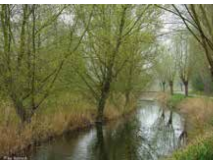
Reflectief fotowerk Proostdijkstraat