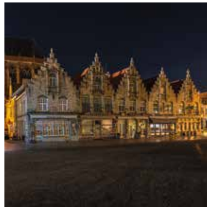
Gouden gevels Grote Markt