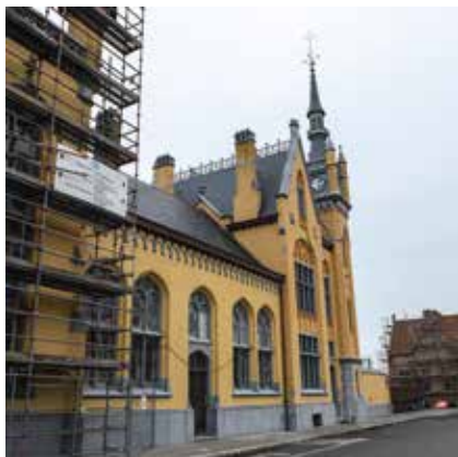
Als een feniks Statieplaats