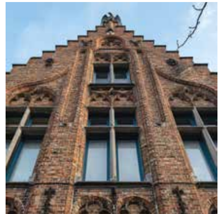
Trapsgewijs richting de hemel Karel Coggelaan