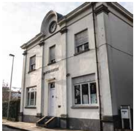
Eén gevel, veel geschiedenis Sasstraat