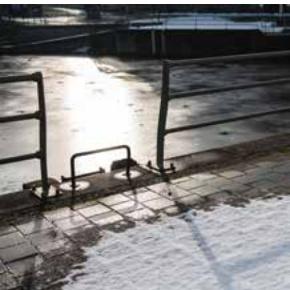
IJs en IJs Kaaiplaats