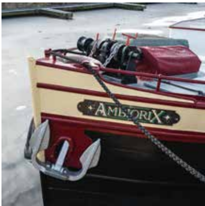
De dapperste aller boten Kaaiplaats