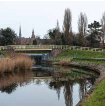
Waterweg naar Veurne Calonnegracht

Heb je zelf zin om als Instagram Veurne Ambassadeur aan de slag te gaan? Stuur dan een mail naar tom.vanrompaey@veurne.be !