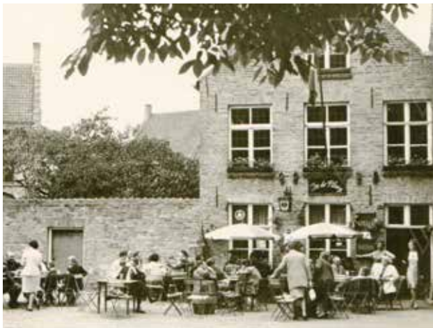
In De Ploeg, Witte Kannunikstraat in Veurne, 1966.

Heb je nog oude foto's liggen van jezelf (of anderen) aan de toog, op het terras of aan de biljarttafel in een Veurns café? Of ken je nog een leuke anekdote over het caféleven in Veurne? Breng ze binnen bij Cultuur&Toerisme Veurne (Grote Markt 29) of mail ze naar michael.lemenu@veurne.be .