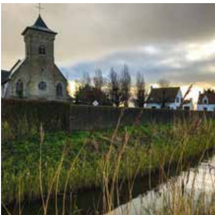
Charme te over Scherpereelstraat Booitshoeke