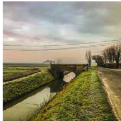
Zelfs in de winter is het heerlijk rondtoeren langs pittoreske plaatsjes in De Moeren. Debarkenstraat/Valkenstraat, De Moeren