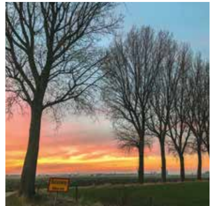
Avondkleuren tussen de bomen om van weg te dromen. Boonakkerstraat Bulskamp