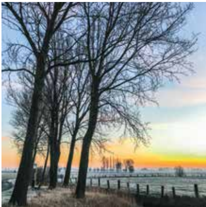
Goudgeel en wit kleuren de wintermorgen in Houtem. Driekoningenstraat, Houtem