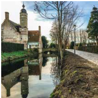
Dubbele pastorie Kerkhoek Houtem