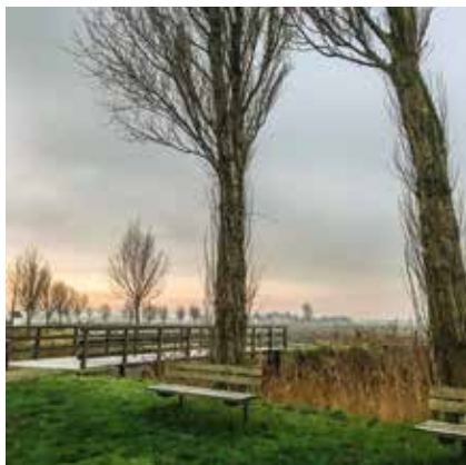
Stop. Rust. Plaats Calonnegracht Veurne