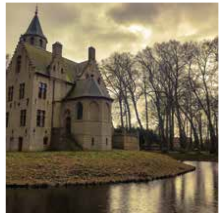
Bomen houden de wacht Kasteel Beauvoorde