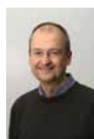
PHILIPPE COCHEZ, N-VA