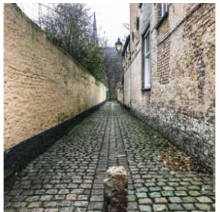
Zelfs op een kleurloze dag verliest dit straatje niets van zijn charme. Citernestraat, Veurne