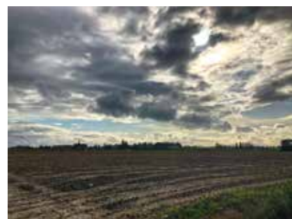
Klein dorp, machtige lichten Lobbestraat