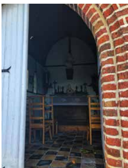
Klein klein kapelletje Booitshoeke