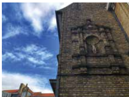
Onopvallend omhoog koekeloeren Grote Markt