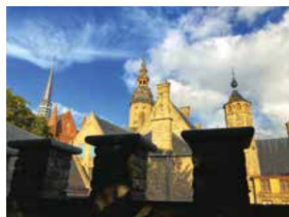
Gouden centrum Stadspark