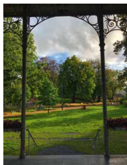
Kiosk with a view Stadspark