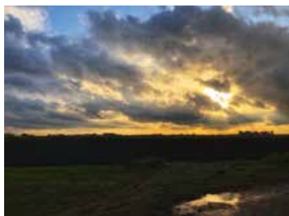
Shock of the Lightning Weidestraat

Wil je ook je kans wagen als Instagram Veurne Ambassadeur? Laat dit weten aan tom.vanrompaey@veurne.be ! Je kan hem ook contacteren via de sociale mediakanalen.