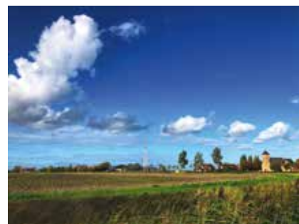
Booits Hoek Henri Scherpereelstraat