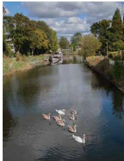
Gevleugelde watergasten Ieperbrug