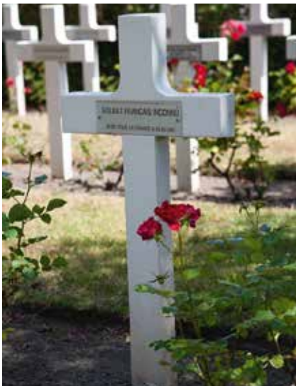
Een nobele roos Oude Vestingstraat