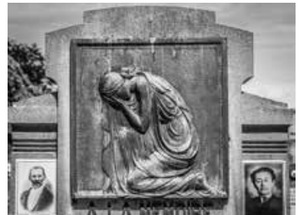
Statisch zwart-witverdriet Oude Vestingstraat