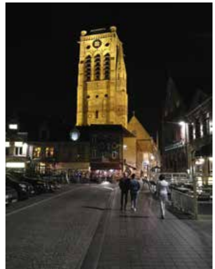
Uitstekend Grote Markt