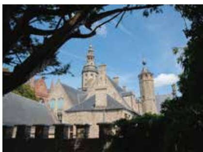
Van de andere kant Stadspark