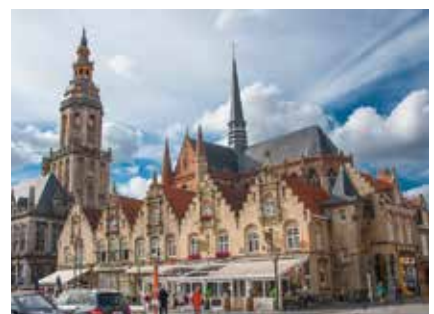
Postkaartperfectplek Grote Markt