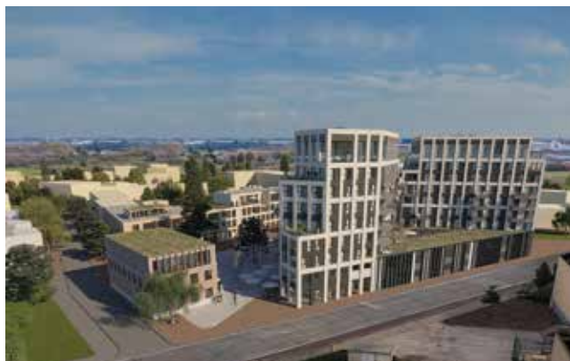
Hoe het moet worden!

De Suikertoren gaat zienderogen de lucht in. Beide torens hebben al een vijfde verdiep bereikt en zouden voor de zomer hun hoogste niveau bereiken. Onder andere de Stedelijke Academie voor Podiumkunsten zal hier worden gevestigd, samen met woningen en enkele handelszaken. Nu al heb je een prachtig panoramisch zicht over Veurne of over het nieuwe natuurgebied Suikerwater. Tegen deze zomer wordt ook gestart met de overige gebouwen rond het Suikerplein. Het oude Tarragebouw zal worden gerenoveerd tot een heuse Incubator, waar ondernemers een plaatsje kunnen innemen. Daarnaast zullen ook de Galerijen worden opgetrokken, bestaande uit een levendige gelijkvloerse verdieping met plaats voor lokale handel en daarboven een aantal appartementen.