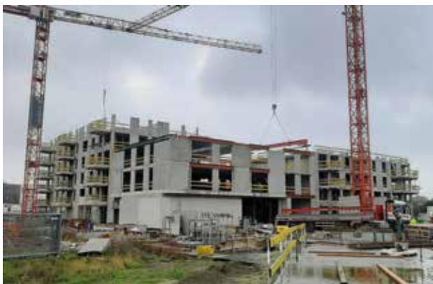
Hoe het nu is ...